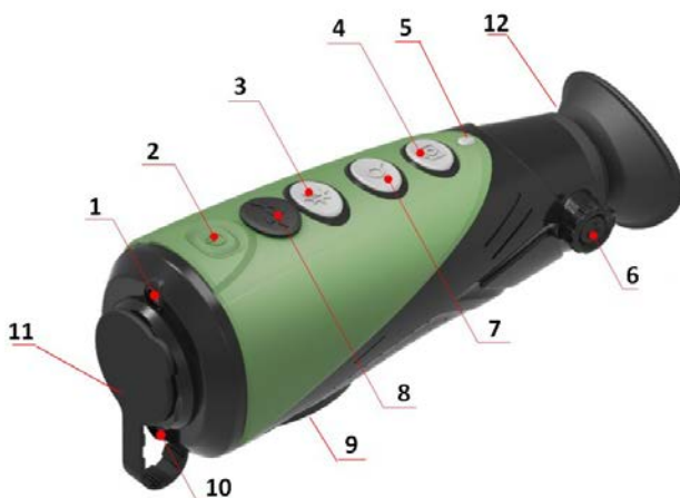
Рис.1 Устройство тепловизора «Е3N»

Основные узлы тепловизора указаны на рис. 1.